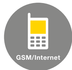
Report a ovládání